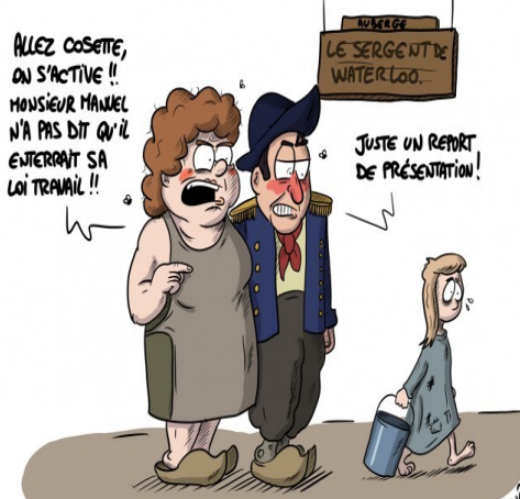
VALLS ANNONCE LE REPORT DE LA PRÉSENTATION DE LA LOI TRAVAIL

La durée maximale de travail de nuit augmentée