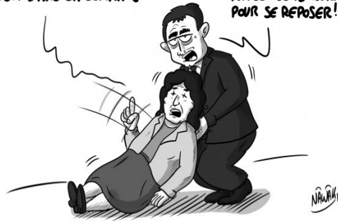
LOI TRAVAIL : LE MALAISE !

AVEC UN MALAISE TOUTES LES 12 HEURES POUR SE REPOSER!