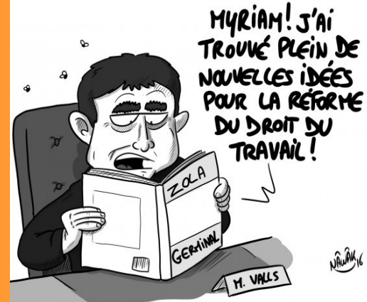
IDÉES DU XIX e POUR « GALICHE » DU XXI e ...

Congés payés : des changements de dates au dernier moment rendus possibles